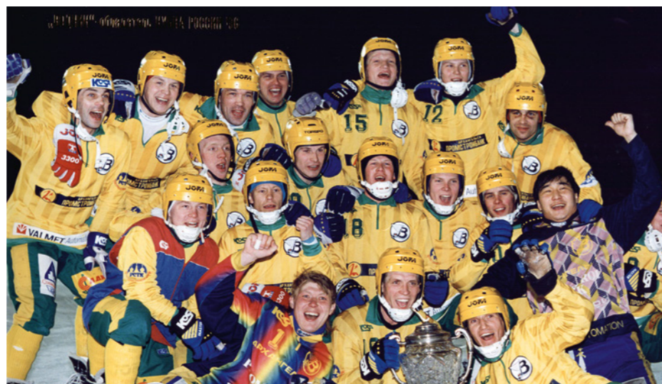
«Водник» — обладатель Кубка России 1996 года

В год 90-летнего юбилея, который «Водник» отпраздновал в январские дни нынешнего года, клуб по-прежнему полон сил и спортивных амбиций для завоевания достойного высокого места в турнирной таблице чемпионата России. ●