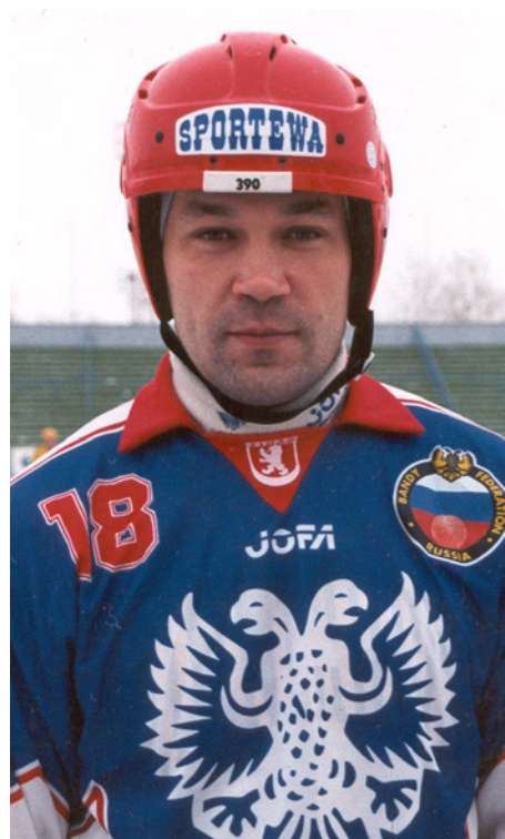
Лидер сборной России Игорь Гапанович