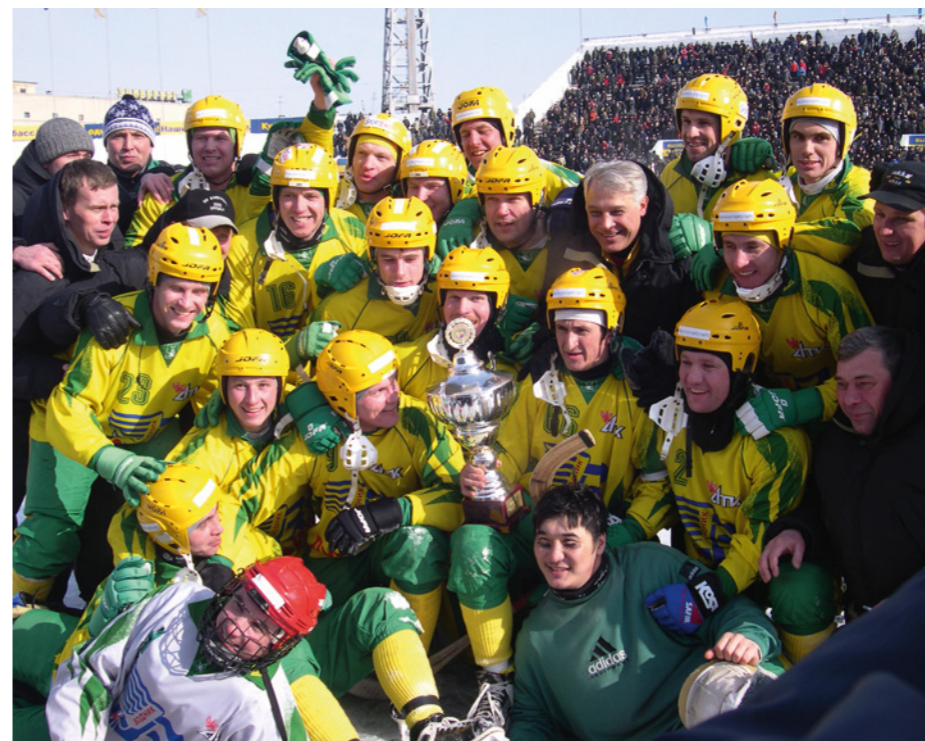
«Водник» - обладатель Кубка России 2005 года