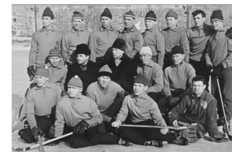
«Водник». Сезон 1965—66 гг.