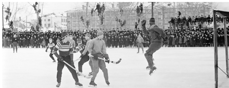
Начало 1960-х годов. Архангельск, стадион «Динамо». Играет «Водник».